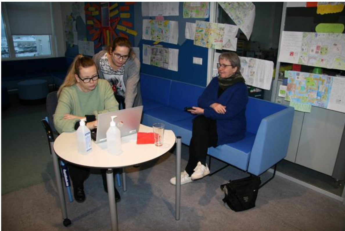
Rýnihópur kennara að skrá hugleiðingar og hugmyndir um opin svæði á göngum.

Padlet-síður eða stafræna veggj með dálkum fyrir sögu rýmanna sem verið var að skoða, notkun í samtíma og möguleg not í framtíðinni höfðum við rannsakendur útbúið fyrir fundinn, eina síðu eða vegg fyrir hvern hóp til að skrá sínar niðurstöður. Við rannsakendur, ásamt skólastjóra, gengum svo frá einum hópi til annars hvar sem þeir voru niður komnir að fást við þetta viðfangsefni. Þeir leyfðu okkur að taka af hópnum nokkrar ljósmyndir í þessu ferli og við reyndum að hjálpa þeim að ákveða hvernig standa mætti að vinnunni. Allir hóparnir komu svo saman undir lok fundar og litu hratt yfir afraksturinn, allar fimm síðurnar eða stafrænu veggina. Allt ferlið virtist ganga greitt fyrir sig og tók innan við tvær klukkustundir.