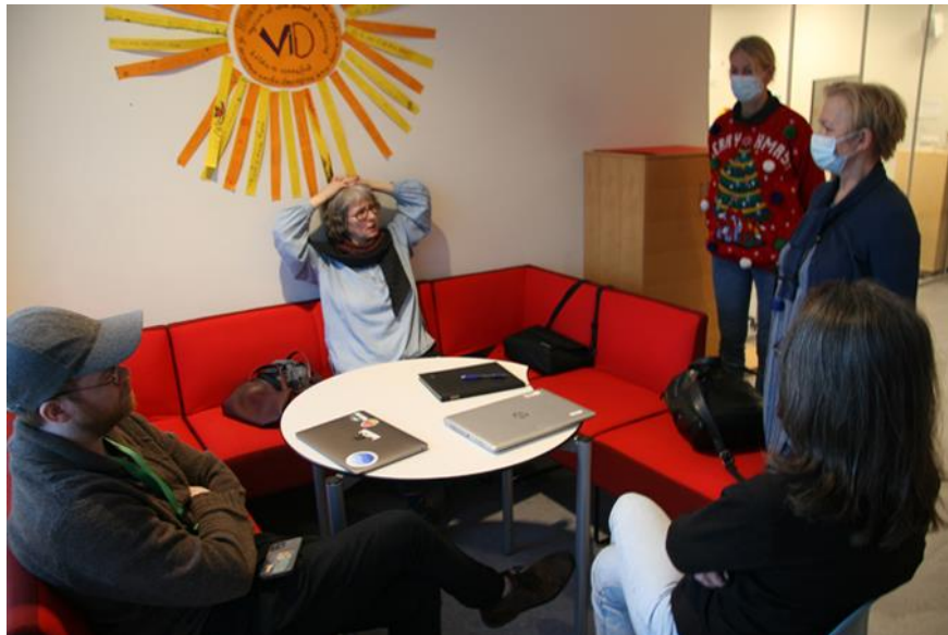
Rýnihópur að velta fyrir sér notkun gangasvæða utan við kennslustofur.

Padlet-síður: Hópur 1: Glerhýsi og útirými á baki – Hópur 2: Glerhýsi og útirými á baki – Hópur 3: Skólatorg og svalir Hópur 5: Gangrými og krókar við stofur – Hópur 6: Gangrými og krókar við stofur – Þátttakendur voru ekki nógu margir til að fylla hóp 4.